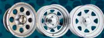
ЛИТЫЕ И ЖЕЛЕЗНЫЕ ДИСКИ