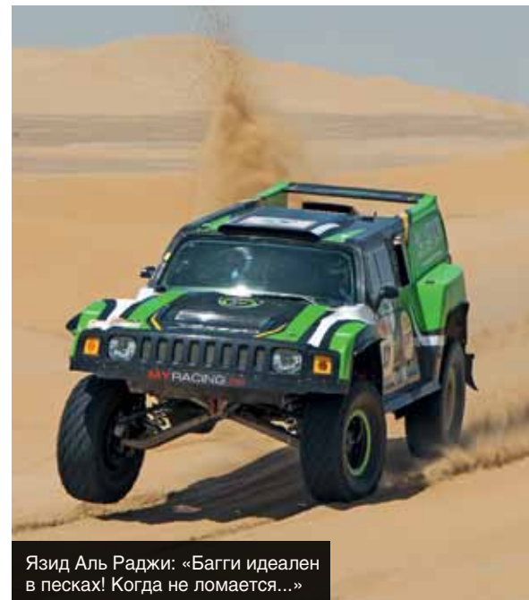
Многоопытный Мирослав Заплетал отлично провел сложную гонку и поднялся на подиум