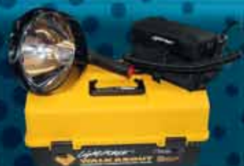
LIGHT FORCE WALKABOUT