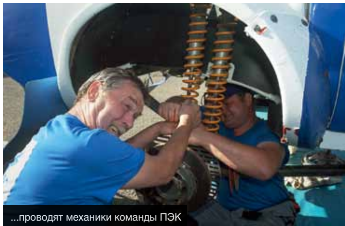
...проводят механики команды ПЭК