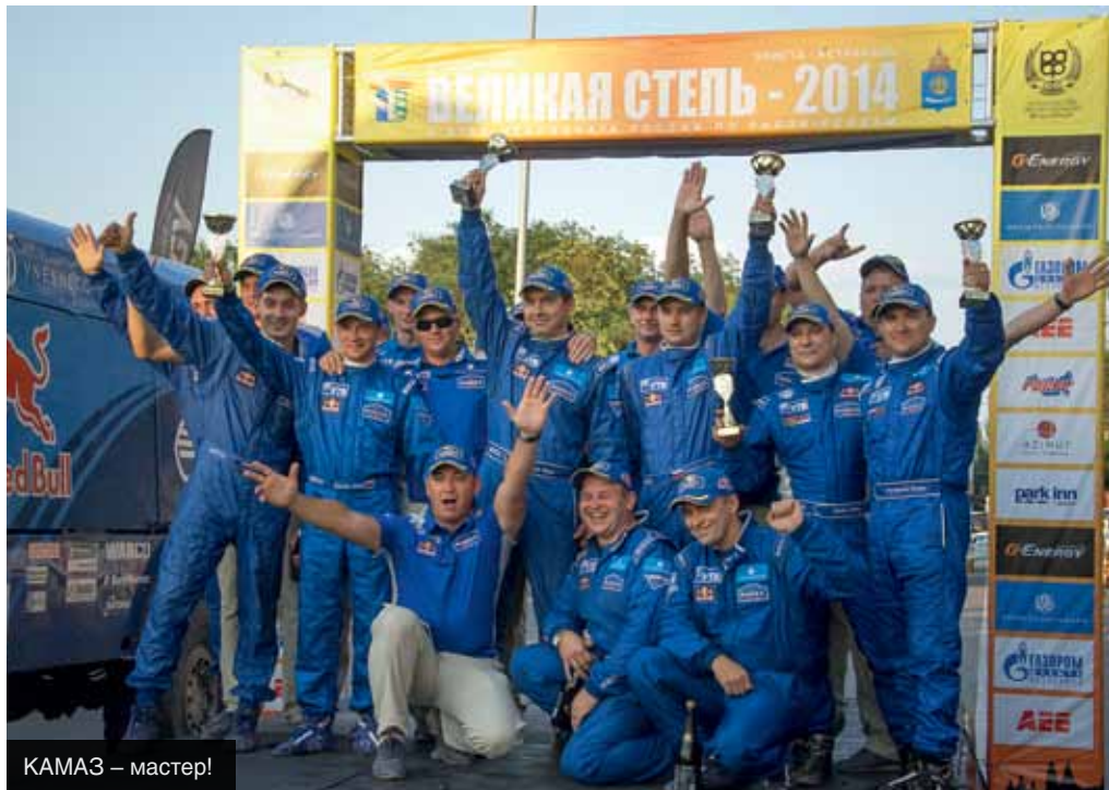
КАМАЗ – мастер!