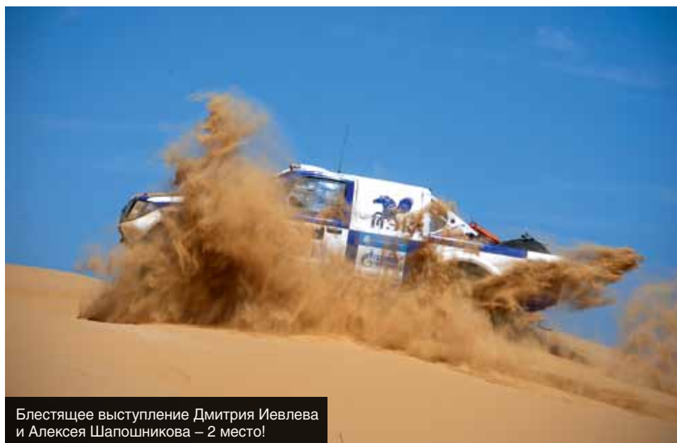
Блестящее выступление Дмитрия Иевлева и Алексея Шапошникова – 2 место!