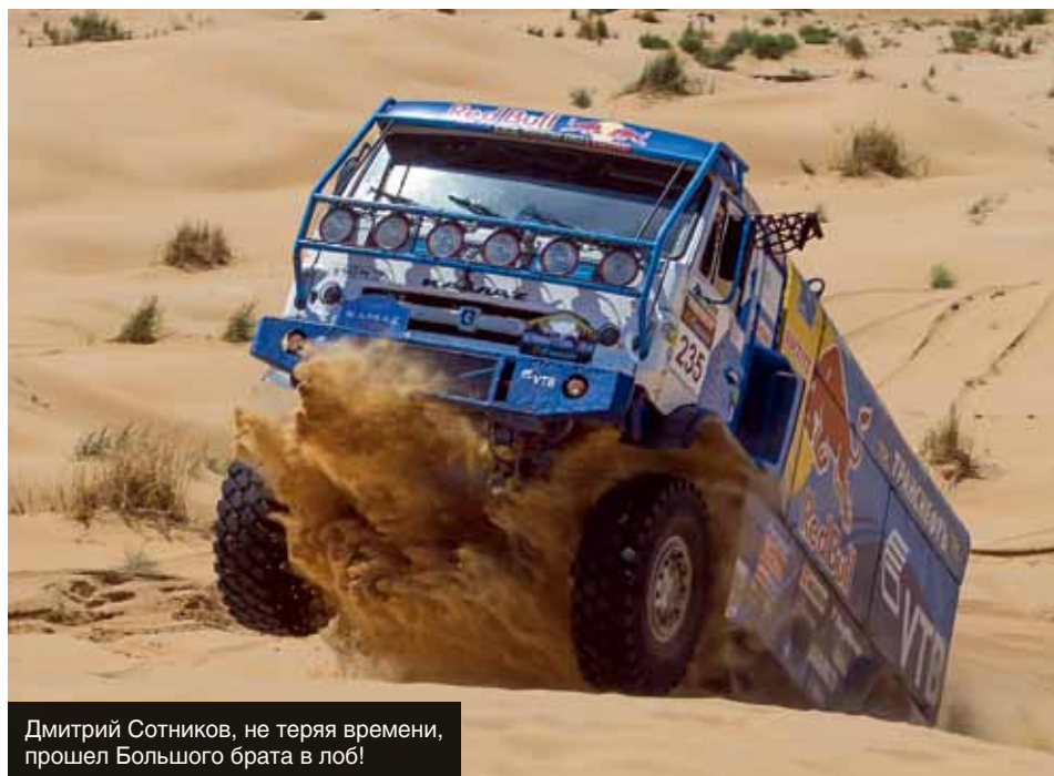
Дмитрий Сотников, не теряя времени, прошел Большого брата в лоб!

ного мнения, до какой величины относительно безопасно спускать колеса, у рейдеров нет. Многое зависит от конкретных условий: температуры, состояния песка, типа резины. Чаще всего говорят об 1,6 атмосферы, но в тяжелых случаях, одной рукой схватившись за сердце, стравливаются аж до 1,2. Интересно, что такая величина пугает не только участников