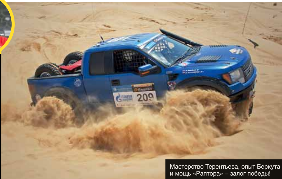
Мастерство Терентьева, опыт Беркута и мощь «Раптора» — залог победы!

Сравнивая прошедшую весной гонку «Золото Кагана» и нынешнюю «Великую степь», могу сказать, что по логистике для команд удобнее та, что базируется в Астрахани. Однако мне намного больше понравился рейд из Калмыкии в Астрахань. Такого же мнения и мои товарищи-гонщики. В весенней гонке было слишком много малоскоростной «долбежки» — езды по жестким степным дорогам. По 10-15 километров такой дороги, что и не разгонишься, и трясет так, что мозги вываливаются из шлема. Это основное ощущение от «Астрахани». А на трассах «Великой степи» дороги были реально скоростными, спускать шины нужно было исключительно в песках. Маршрут здесь подобран грамотно — даже в астраханской степи нашлись относительно мягкие дорожки. Навигация была весьма понятной и корректной, ошибки в «легенде», конечно, были, но мало. В общем, «Великая степь» понравилась больше! Единственное, что было сделано не лучшим образом — приборы контроля прохождения дистанции. Они не передавали информацию он-лайн, а проверялись организаторами только после финиша. Тем самым наших болельщиков (а их и так не слишком много!) лишили возможности следить за борьбой на трассе. Если ведется мониторинг, то сразу видна ситуация в гонке: кто где находится, кто кого обгоняет. Когда видны позиции экипажей — больше интриги. На этой же гонке было так: 6 часов молчания, после чего публикуется результат. Но в целом от «Великой степи» осталось исключительно позитивное впечатление.