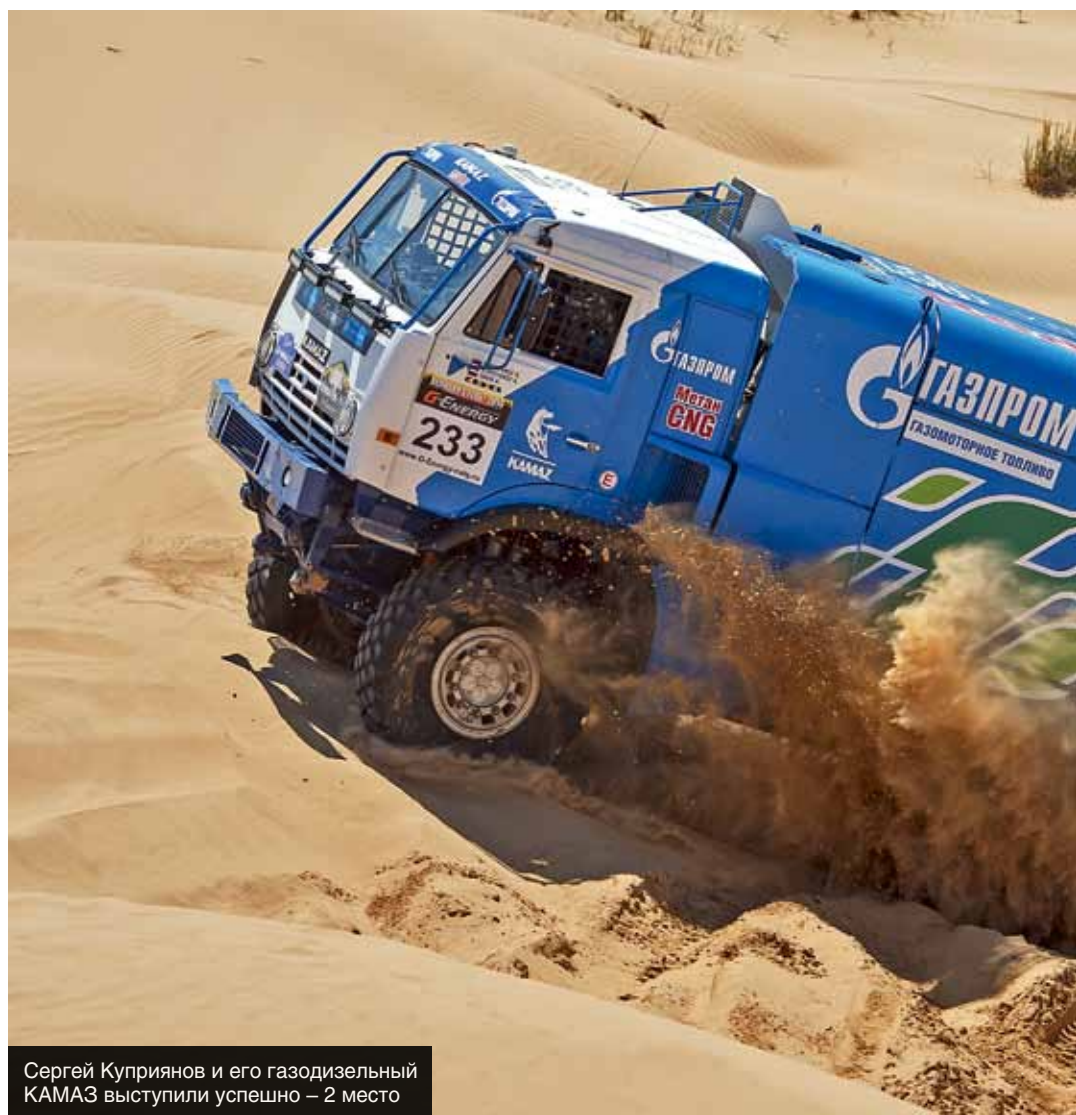
Сергей Куприянов и его газодизельный КАМАЗ выступили успешно – 2 место