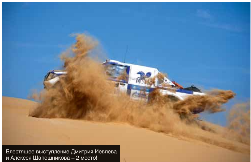
Блестящее выступление Дмитрия Иевлева и Алексея Шапошникова – 2 место!