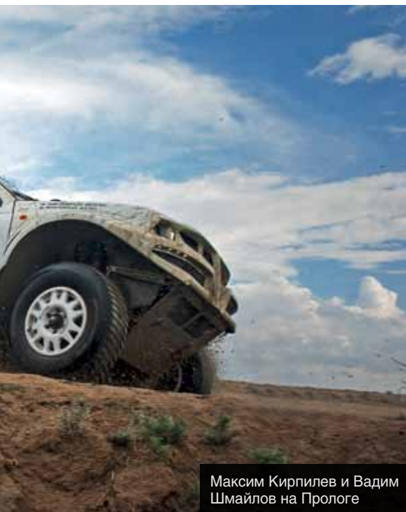
Максим Кирпилев и Вадим Шмайлов на Прологе