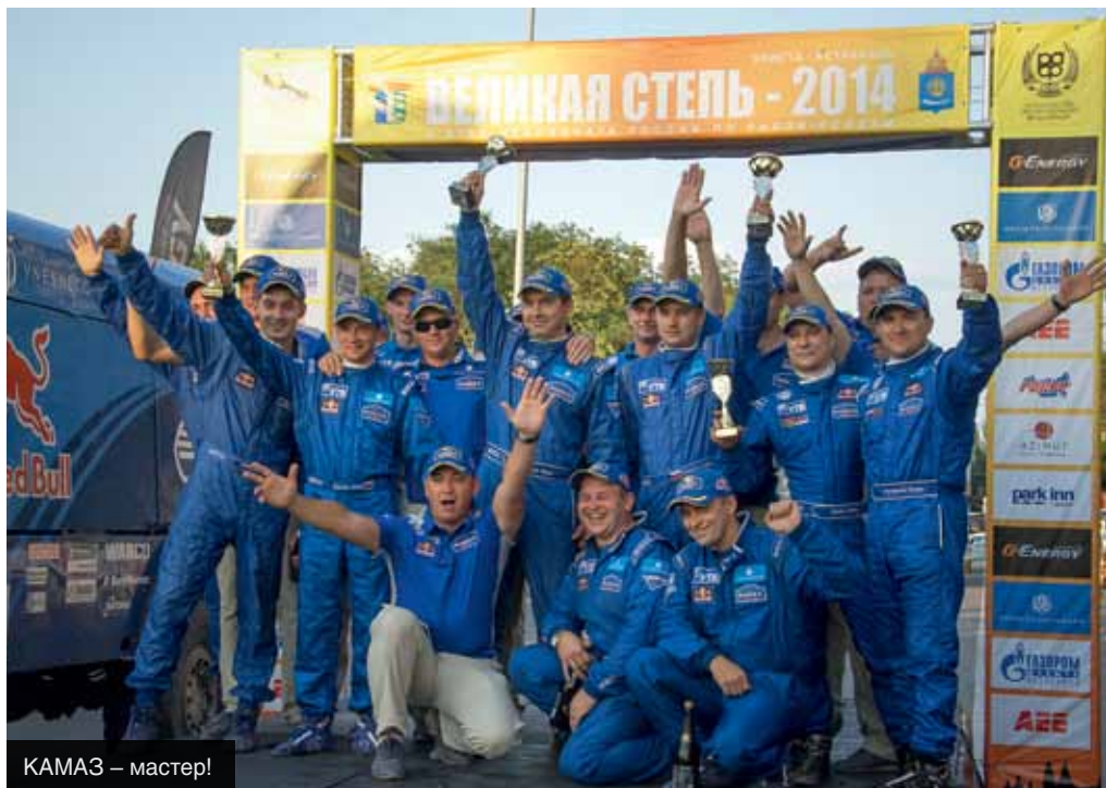
КАМАЗ – мастер!