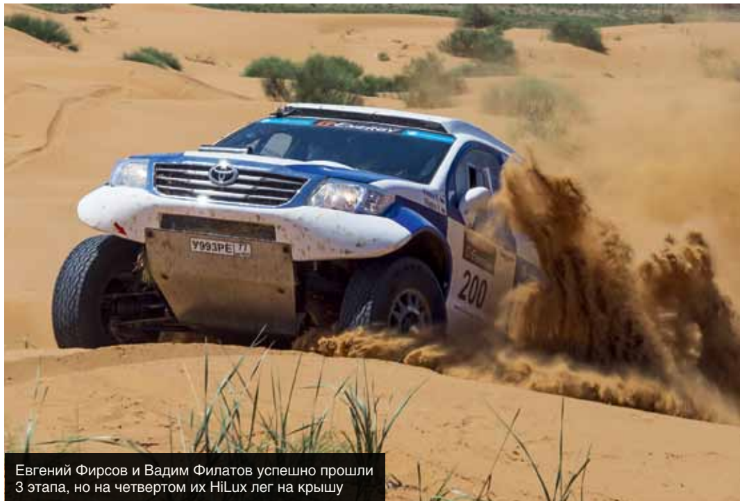
Евгений Фирсов и Вадим Филатов успешно прошли 3 этапа, но на четвертом их Hilux лег на крышу