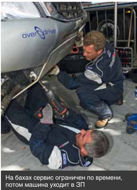
На бахах сервис ограничен по времени, потом машина уходит в ЗП