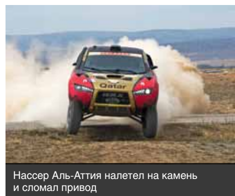
Нассер Аль-Аттия налетел на камень и сломал привод