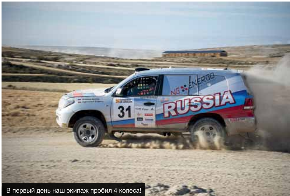
В первый день наш экипаж пробил 4 колеса!