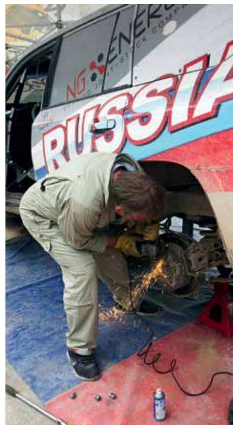
На вечерний сервис отводился только один час