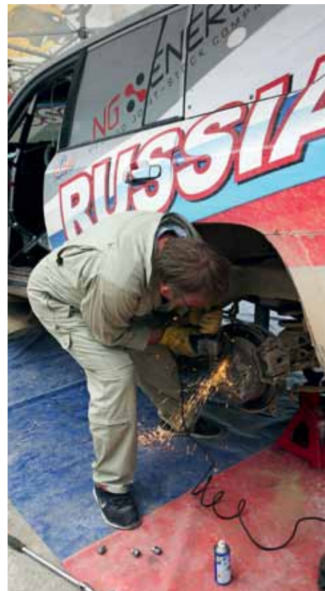
На вечерний сервис отводился только один час