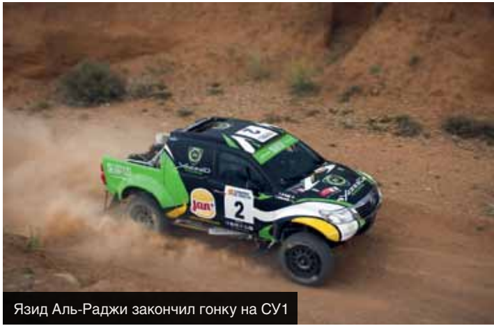
Язид Аль-Раджи закончил гонку на СУ1