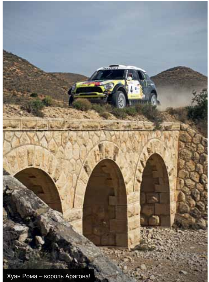
Хуан Рома – король Арагона!